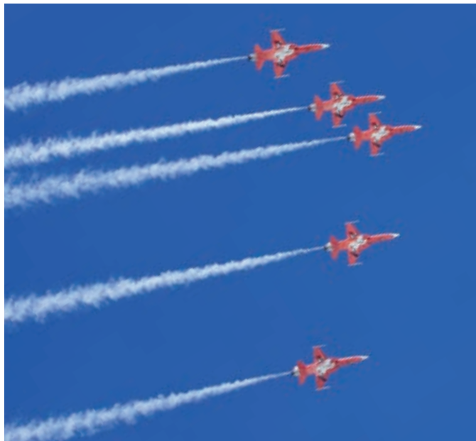
La Patrouille Suisse, fière illustration du savoir-faire de notre armée, doit être conservée.

L'UDC souhaite une armée défensive bien équipée et bien formée n'attendant personne, mais toujours prête à défendre l'indépendance nationale. Une armée qui renforce l'image d'une Suisse neutre, prévisible et contribuant à la sauvegarde de la paix. Le crédit global de 5 milliards de francs approuvé par le Parlement pour un effectif de 100 000 soldats ne permet pas à l'armée de remplir cette mission qui, outre la défense du pays comprend également l'assistance aux autorités civiles (par ex., en cas de catas-