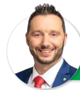
Par Yvan Pahud Conseiller national, L'Auberson (VD)

Demain, nos maisons individuelles seront-elles sacrifiées afin de loger les 100'000 personnes qui immigreront en Suisse chaque année ? C'est hélas la dérive inquiétante que l'on voit poindre à Berne. Sous prétexte de pénurie de logements, la Confédération encourage toujours plus de constructions compactes, au détriment de notre cadre de vie, de notre propriété et de notre identité.