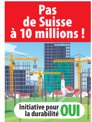
Affiche B1 « aggro »